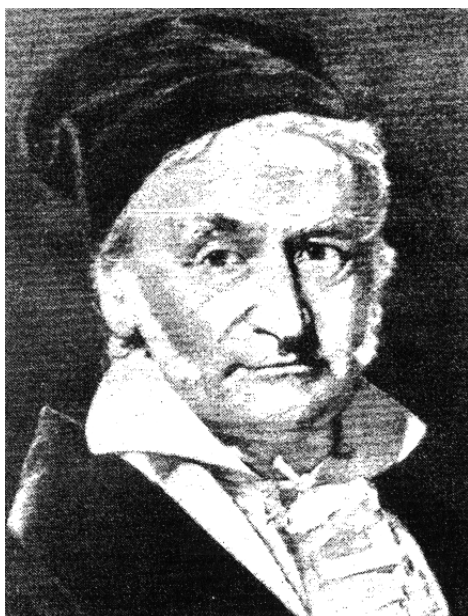
Carl Friedrich Gauss (1777-1855)

Personne ne put en obtenir d'autres avant 1796. A cette date, Carl Friedrich Gauss démontra qu'un polygone régulier à nombre impair de côtés était constructible si et seulement si ce nombre était un nombre premier de la forme 2^{(2^n)} + 1 ou une combinaison de tels nombres.