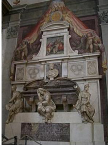
Vasari, Tombeau de Michel Ange, Santa Croce, Florence