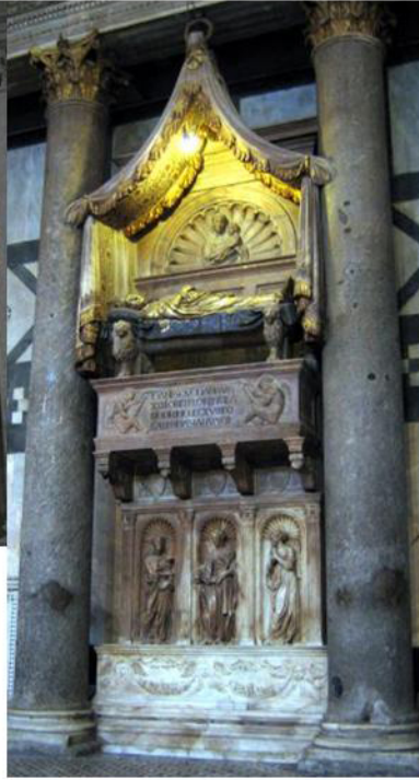
Donatello le tombeau de Jean XXIII (Baptistère).