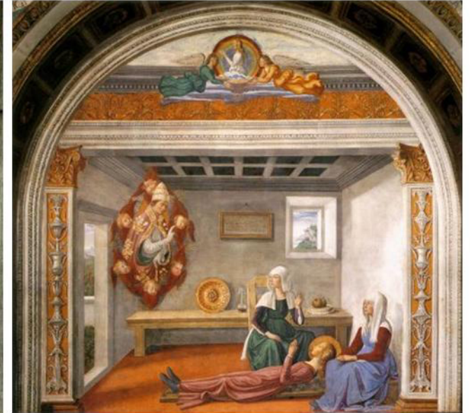
Ghirlandaio, La chapelle Santa Fina, deux fresques (Collégiale de San Gimignano)