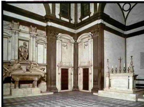
Brunelleschi, Donatello et Verrocchio L'ancienne sacristie et Michel Ange la nouvelle sacristie (église de San Lorenzo)