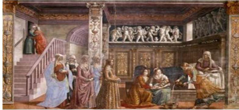
Ghirlandaio : les fresques du chœur de Santa Maria Novella