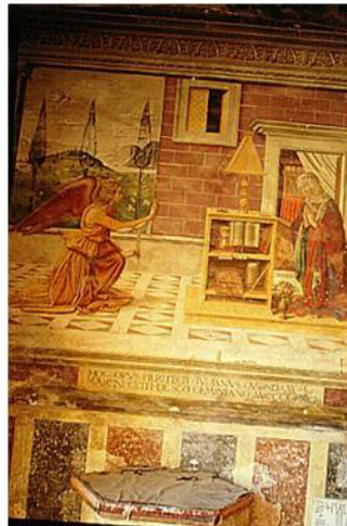
Ghirlandaio : fresque de L'annonciation (cloître du dôme à San Gimignano)