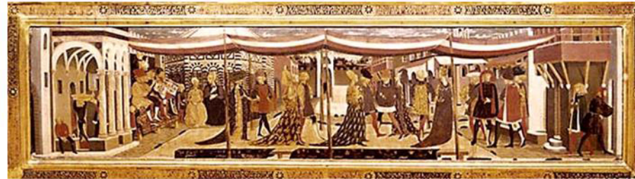
Le coffre de mariage, dit des noces Adimari : Galerie de l'Acadé-